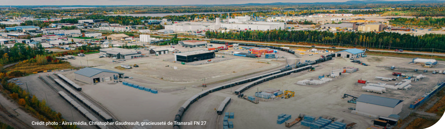
Crédit photo : Airra média, Christopher Gaudreault, gracieuseté de Transrail FN 27